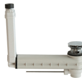
AB- UND ÜBERLAUFGARNITUR